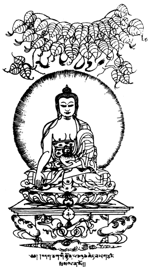
Phật Thích Ca Mâu Ni Lama Zopa Rinpoche phát họa

Tựa đề tiếng Anh The Noble Mahayana Sanghatasutra Dharma-Paryaya