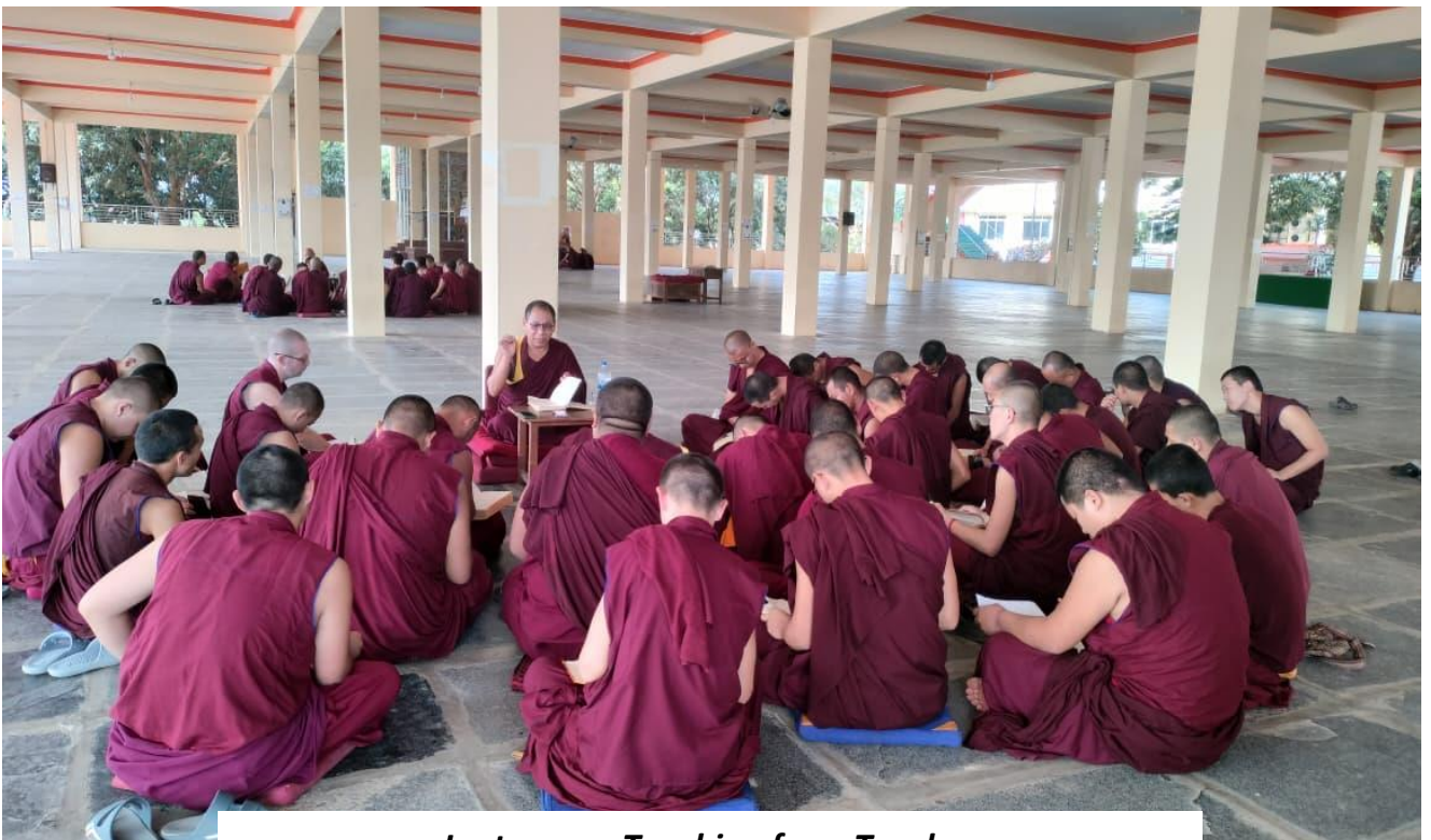
Lectures or Teaching from Teacher