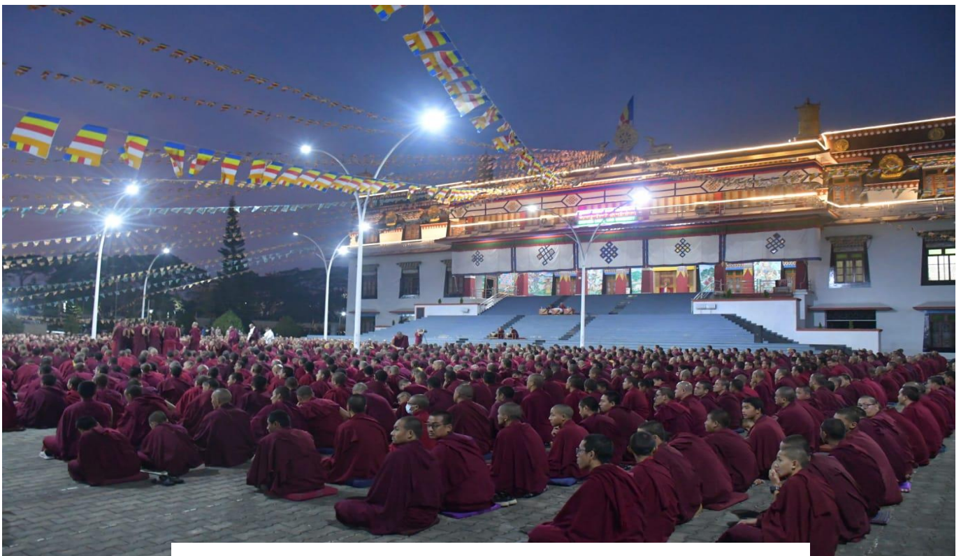
Debate session with the entire monastic community