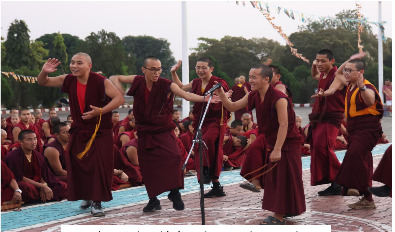
Debate session with the entire monastic community

P.O Bylakuppe-571104 District Mysore K.S India.