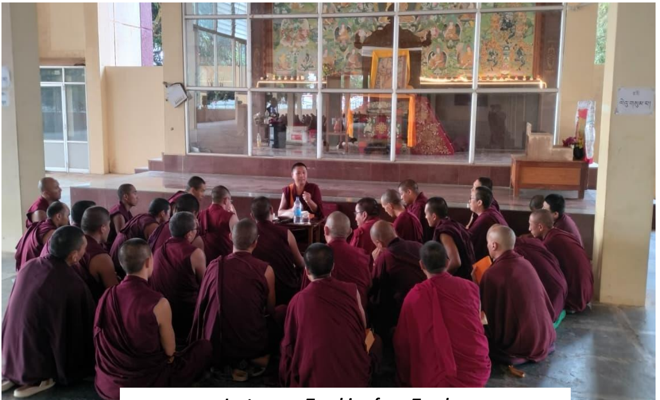
Lectures or Teaching from Teacher